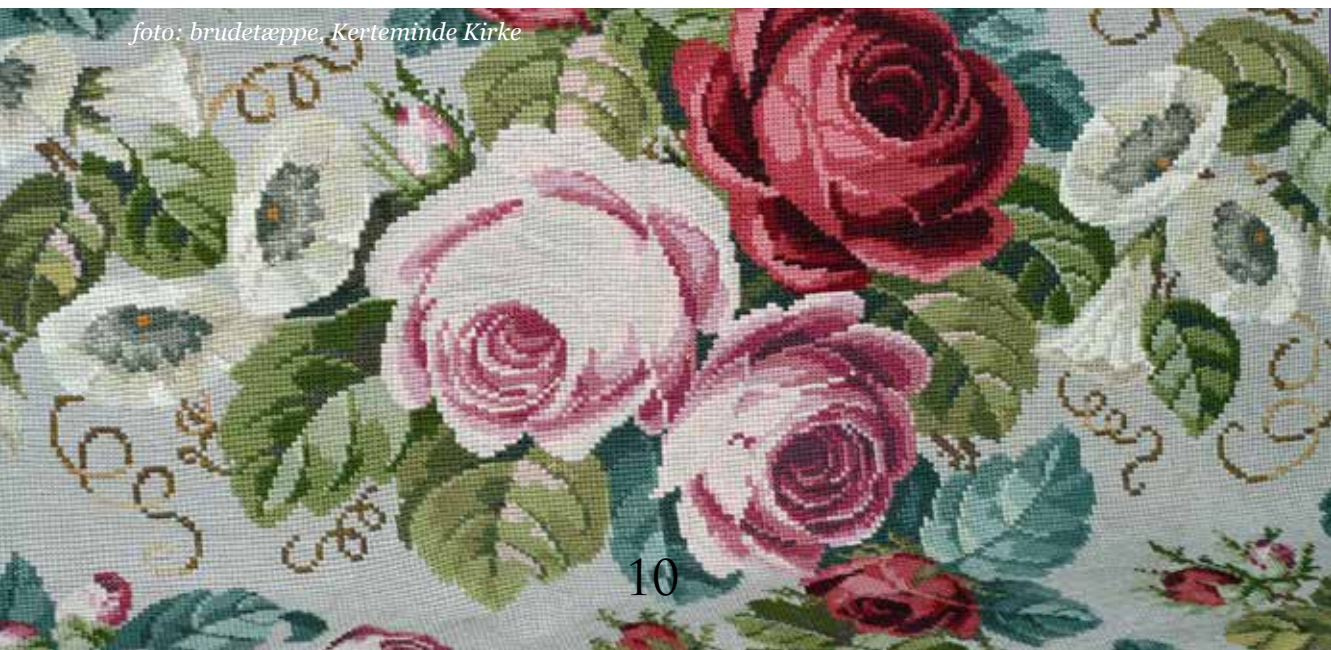
foto: brudetæppe, Kerteminde Kirke

De følgende søndage er: 18. februar: Drigstrup Kirke kl. 14.00 3. april: Dalby Kirke kl. 14.00